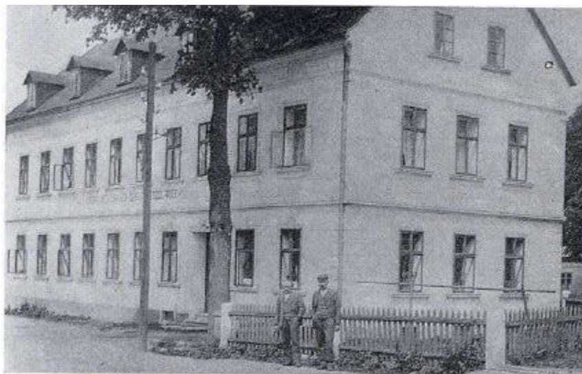
Die frühere „Richter-Wenzel“ Knopf- und Metallwarenfabrik