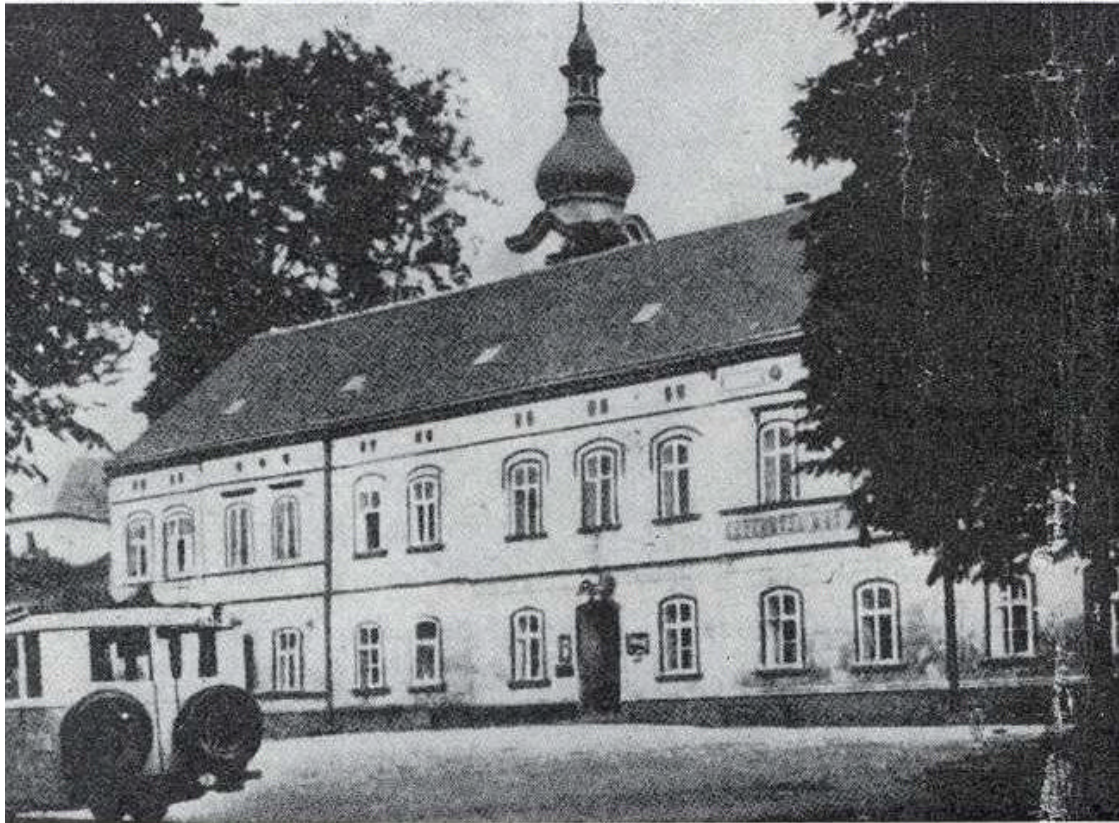
Das Rathaus in Peterswald

Im Jahre 1868 wurde das Gemeindegasthaus - die frühere Post - als baufällig abgetragen. Im gleichen Jahre wurde das „Rathaus“ erbaut. Das angebaute Stallgebäude mit den im Obergeschoß befindlichen Wohnräumen wurde 1881 abgetragen.