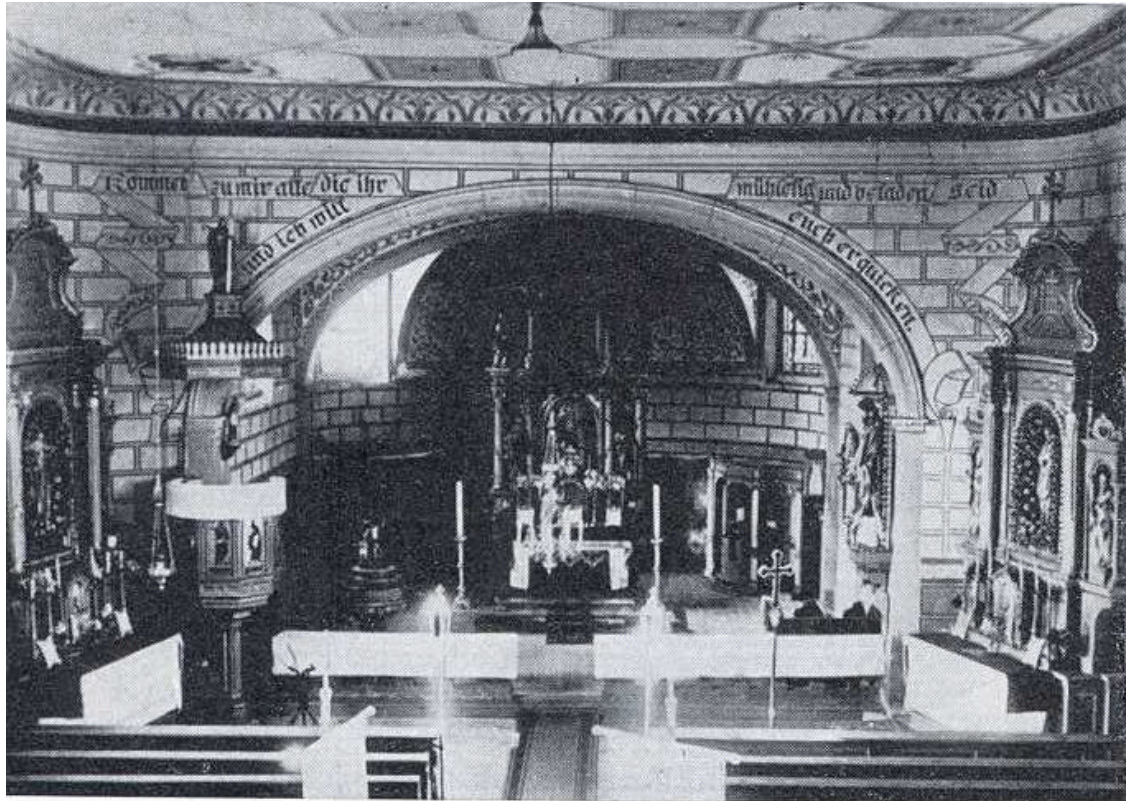
Kirche St. Nikolaus in Peterswald