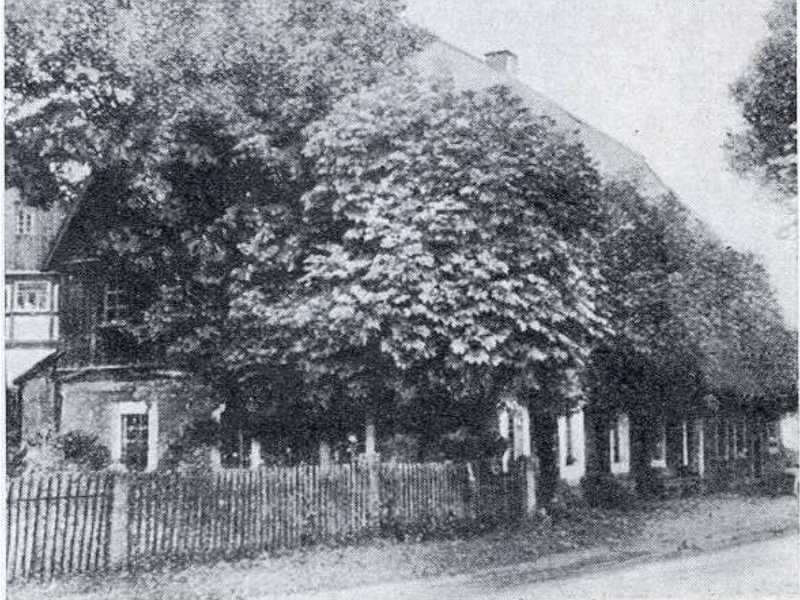
DIE UNTERE SCHENKE IN PETERSWALD · (Der Kastanienhof)